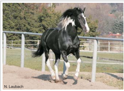
Taffy im März 2004 im Alter von 20 Jahren !!!

Rappschecke, Tobiano, 100% Farbvererber, geboren 06.08.1984; Stockmaß 152 cm, sehr groß vererbend! Hengstbuch 1 (HB1) beim ZfdP 1994, Zuchtbuch Pinto-Kl. Reitpferd und Pinto-Pony